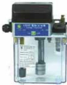
CESP 撥鍵式 CESP Dial Type (Timer Inside The Wire Box)