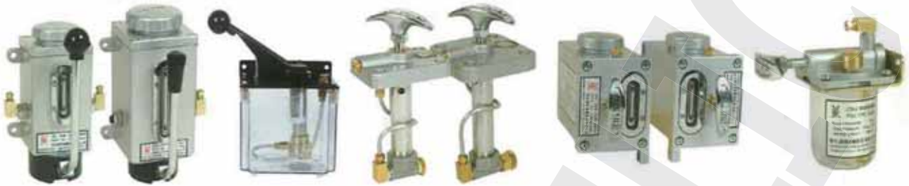
CLA-6、CLA-8手搖式 CLA-6、CLA-8 Type