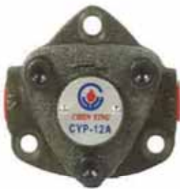
CYP-12A 單面轉式給油幫浦 CYP-12A Rotary Oil Pump