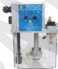
CESW 雙旋鈕式 CESW Two Time Adjuster Type