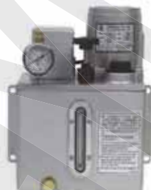
CEV-02 由PLC控制時間 CEV-02 Controlled By PLC