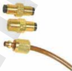
比例接頭 Proportion Adapter