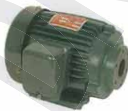
鐵殼臥式直結馬達 Cast Iron Horizontal Motor