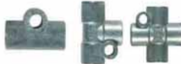
雙接頭、三通管、四通管 Junctions \Phi 4, \Phi 6, \Phi 8