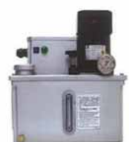
CEV-05 60W含壓力開關 CEV-05 60W With Pressure switch