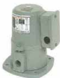
自吸式馬達 Suction Pump