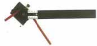
彎管器 Multiple size \Phi 4-\Phi 10 Tube Bender