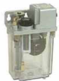
CESS 1L型 CESS 1L Type