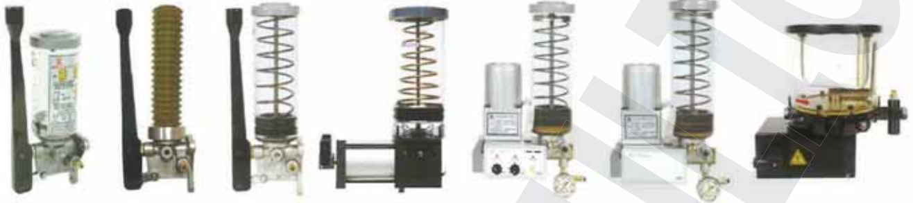
CLHA-20 手動式600cc CLHA-20 Manual 600cc NLGI0~000