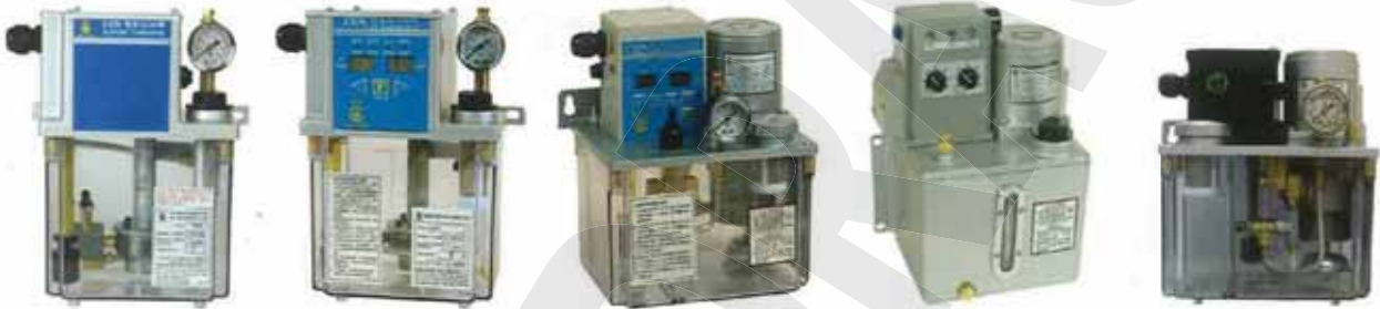
CEN03 由 PLC 控制時間 CEN03 Controlled By PLC