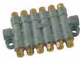
T型檢知容積式分配器 T Type Detectice Volume Distributor