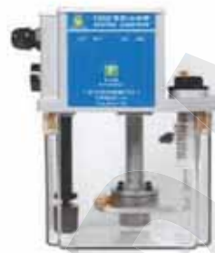
CESD 時間調整鈕 在配線蓋內 CESD Timer Inside The Wire Box