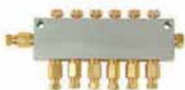
B型油量調整分配器 B Type Adjustable Distributor