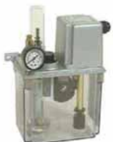
CESMB 密封式 CESMB With Float Switch