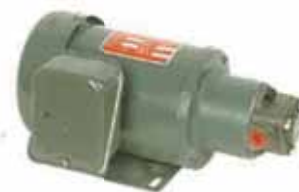
鐵殼臥式連軸馬達+給油幫浦 Horizontal Motor With Oil Pump