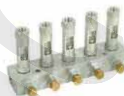
BS型透明調整分配器 BS Type Adjustable Distributor