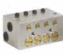
CO型油氣式容積式分配器 CO Type Oil-Air Volume Distributor