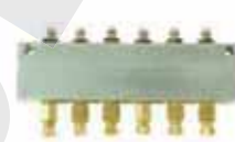
BB型黃油嘴黃油分配器 BB Type Grease Nipple Distributor