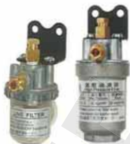
高、低壓過濾器 High and Low Pressure Filter