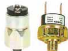
壓力開關 Pressure Switch