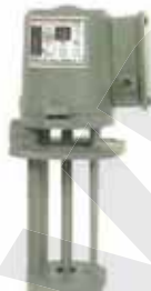
浸水式馬達 Immersion Pump