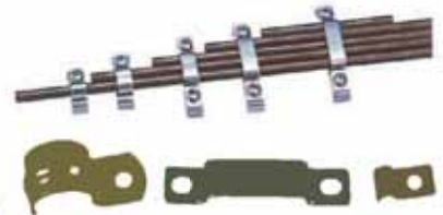
各式管夾 Tube Clips