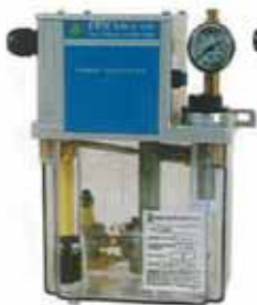
CEN01 由PLC 控制時間 CEN01 Controlled By PLC