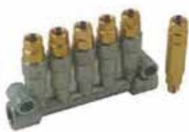
CAB型容積式分配器 CAB Type Volume Distributor