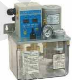
CENA 微電腦式 CEN NC IC Controlled