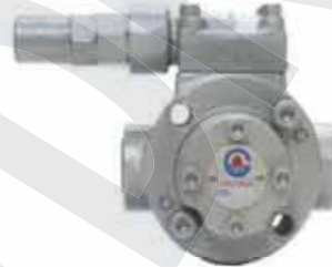
CYP-204 重油給油幫浦 CYP-204 Heavy Oil Pump