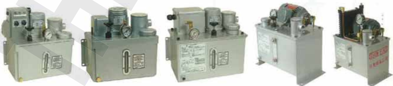
CEF 雙旋鈕式 CEF Two Time Adjuster Type