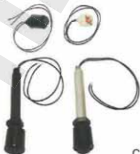
浮動開關 Float Switch