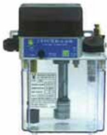
CESH 單旋鈕式 CESH Single Time Adjuster Type