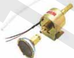
電磁幫浦 Electro-magnetic Pump