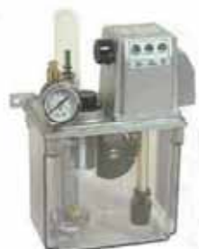
CESC 加蜂鳴器式 CESC With Buzzer Device