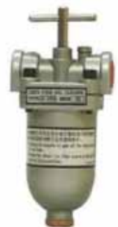
自動油過濾器 Oil Auto Cleaner