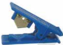
切管機 Tube Cutter