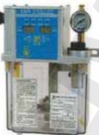
CEN02 微電腦式 CEN02 NC IC Controlled