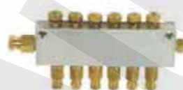
CB螺母型防震動分配器 CB Type Anti-Vibration Distributor