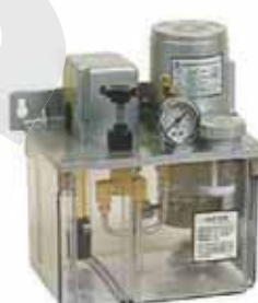
CEV-03 由PLC控制時間 CEV-03 Controlled By PLC