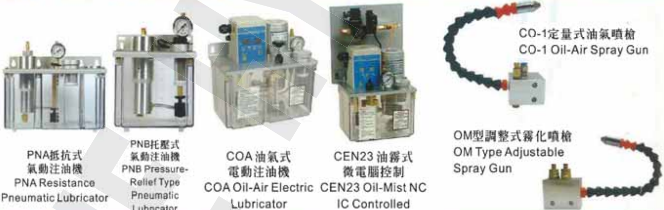
PNA 抵抗式氣動注油機 PNA Resistance Pneumatic Lubricator