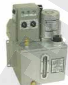
CEA 雙旋鈕式 CEA Two Time Adjuster Type