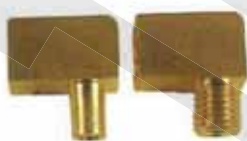
直角接頭 Elbow Adapter Pipe Dia : \Phi 4, \Phi 6, \Phi 8, \Phi 10