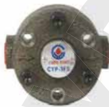
CYP-3FS 雙面轉式給油幫浦 CYP-3FS Rotary Oil Pump