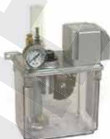
CESA 自動活塞式 CESA Without Float Switch